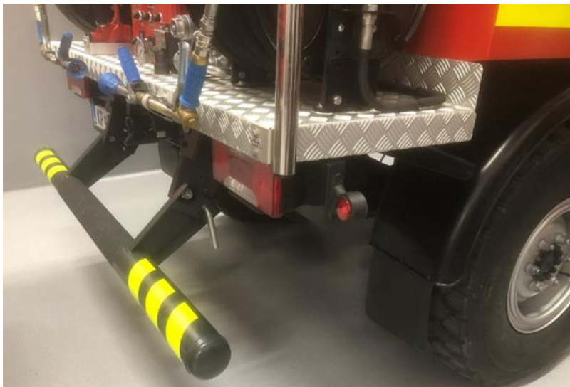
SLIKA 1: NALETNI ODBIJAČ

Na zadnjem delu vozila je montiran original naletni odbijač z originalnimi lučmi, zaščitenimi proti mehanskim poškodbam, in nosilcem registrske tablice. Po celotni dolžini odbijača se namesti protizdrsna podlaga za preprečitev zdrsa pri stopanju na odbijač.