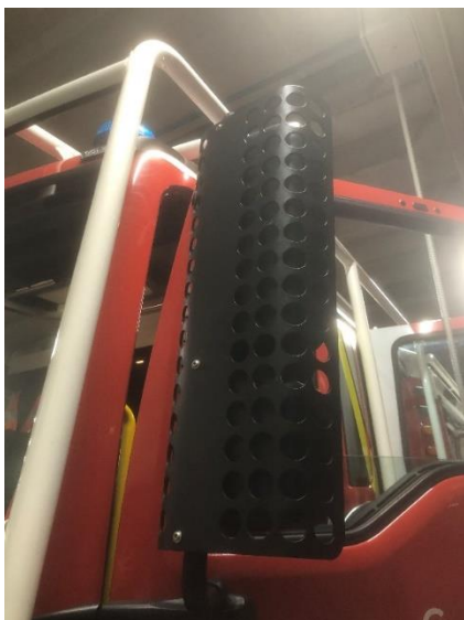
SLIKA 2: ZAŠČITA PROTI UDARCEM, VZVRATNA OGLEDALA

Zadnje luči so zaščitene proti udarcem z zaščitno mrežico ali z drugo ustrezno konstrukcijsko rešitvijo. Z zaščitno mrežico ali drugo ustrezno konstrukcijsko rešitvijo proti udarcem zaščiti obe vzvratni ogledali in LED bar.